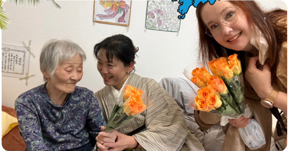
Miho-sanin ja hänen äitinsä luona vierailulla äitienpäivänä. Sängyn viereen on kiinnitetty äidin tuore kastetodistus.