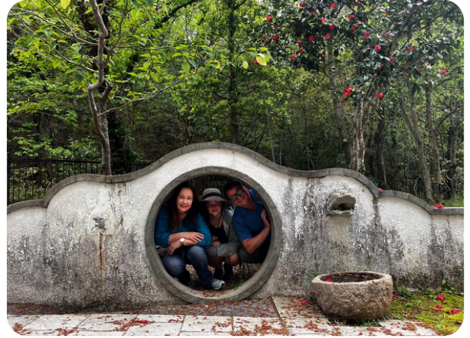
Abiturienttimme kanssa, pian hänkin jaa Suomeen opiskelemaan ja jäämme kaksin.

Pian tulemme Suomeen puoleksi vuodeksi! Tähän mennessä sovitut vierailut löytyvät kotisivuiltamme www.palmu.st → Vierailuajataulu 2026 .