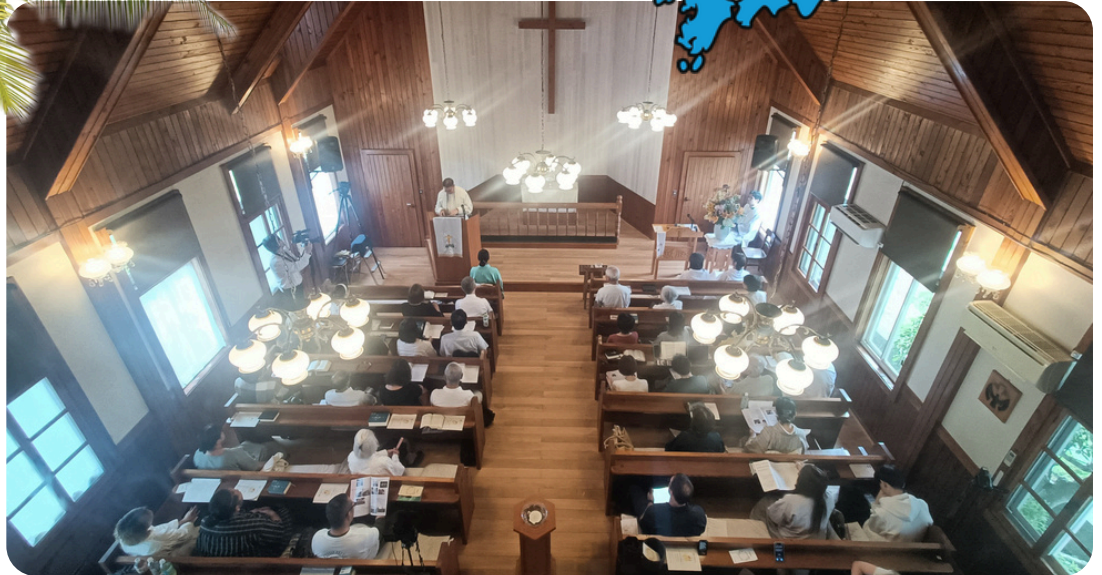
Ananin seurakunnan 50-vuotisjuhlijumalanpalveluksesta