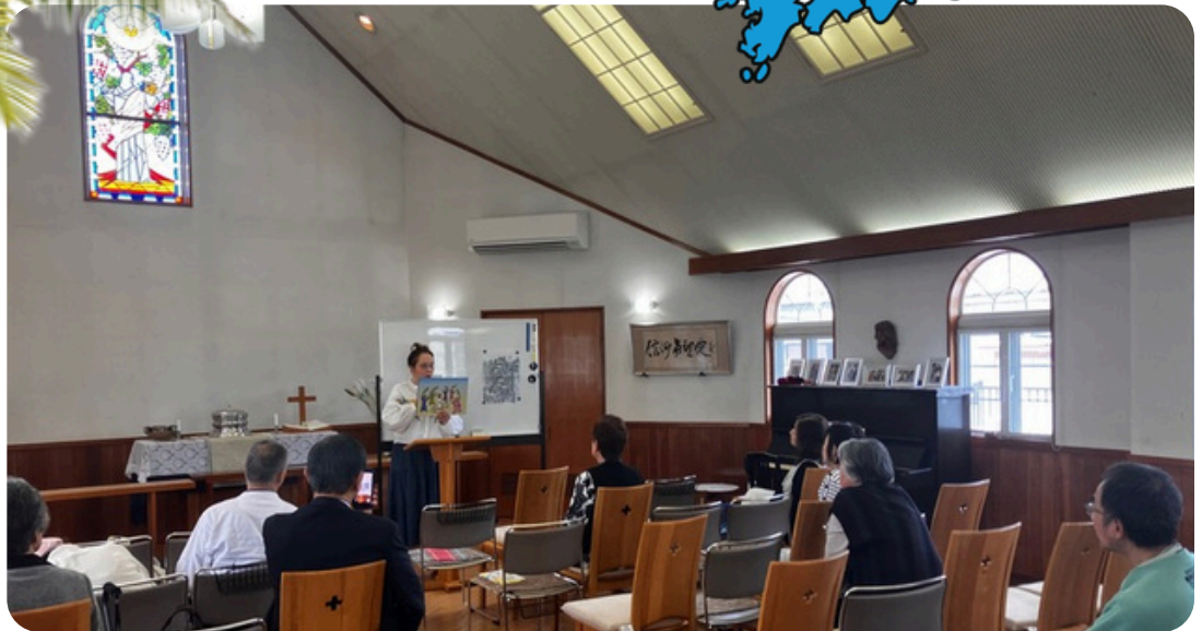
Asakon pyhäkoulunopetus Itä-Tokushiman kirkolla pääsiäisenä