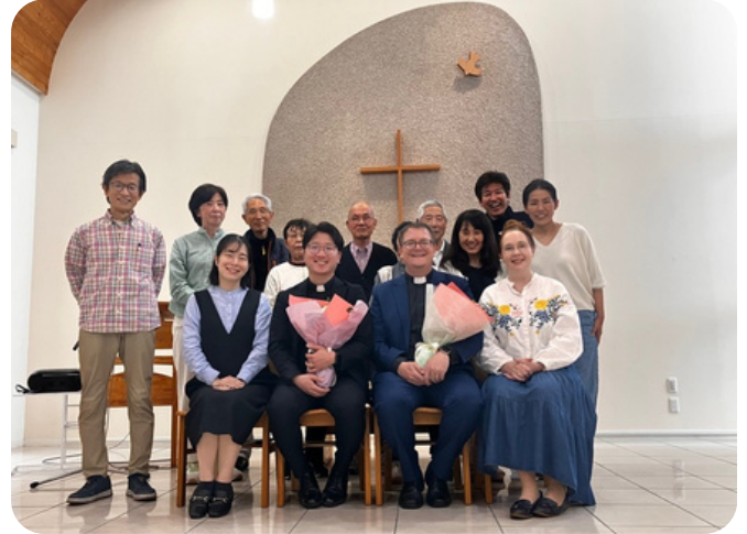
Pääsiäisjumalanpalveluksessa Awajin seurakunta kukitti uudet työntekijänsä

Tulemme myös vierailemaan nimikkoseurakunnissamme tämän jakson aikana, joten heinä-tammikuun aikana on