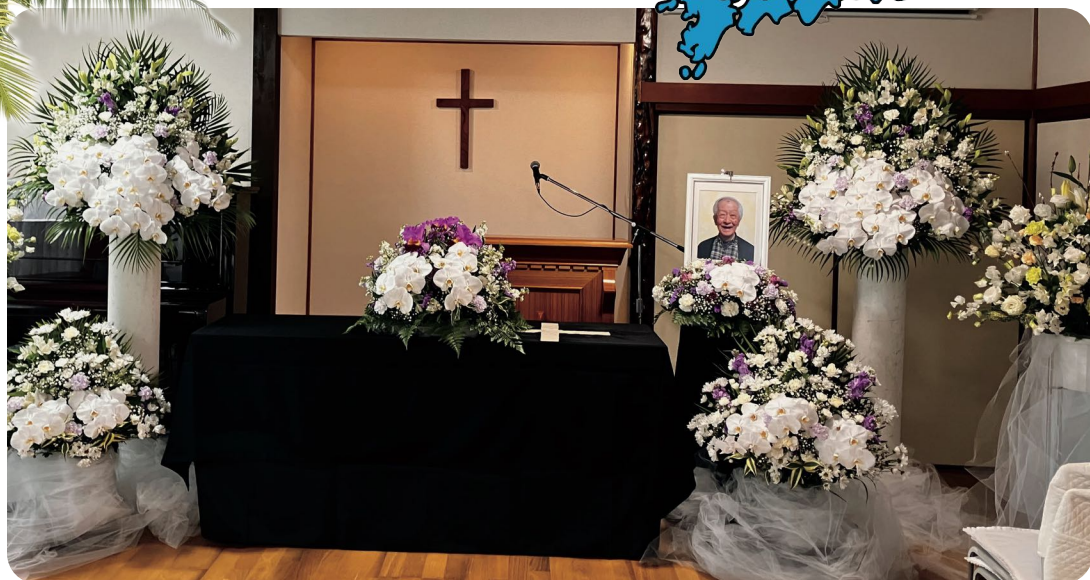
Kita-Suzurandain seurakunnan jäsen, 84-vuotias mies sai taivaskutsun keskiviikkona 4.2. Hautajaiset pidettiin heti 7.2. lauantaina