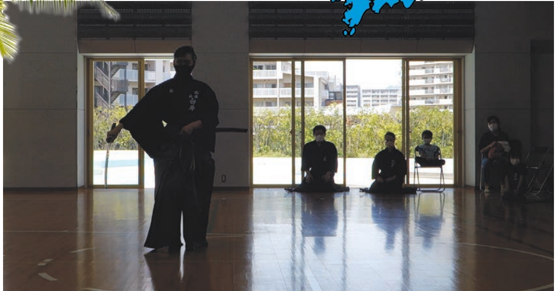
Seitsemännen asteen iaido-miekkamestari esiintyi meillä.