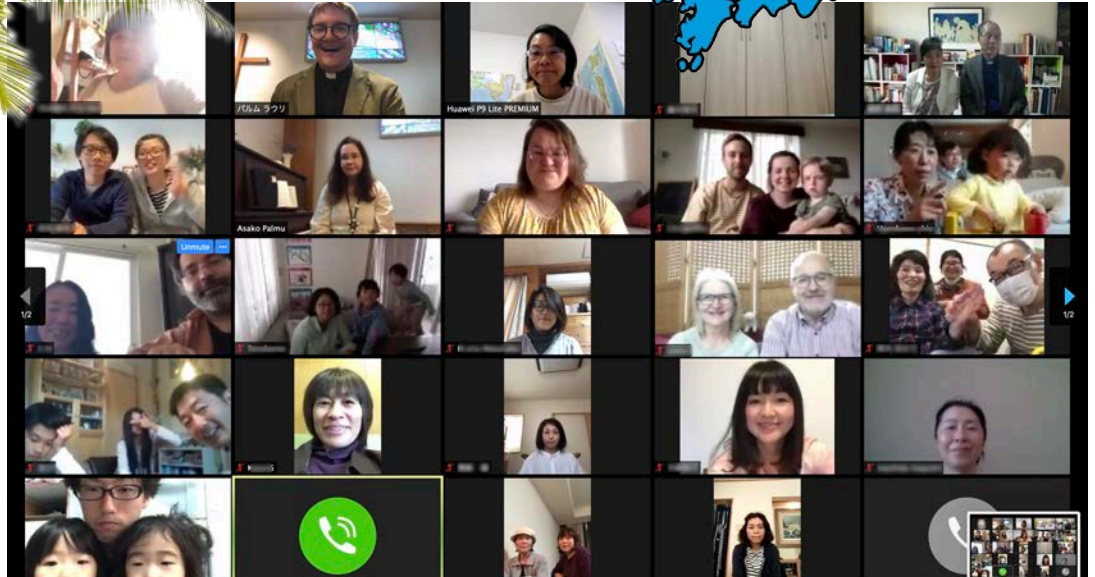
Toukokuun 10. päivän jumalanpalveluksessa oli yli viisikymmentä kirkkoviehasta. Huimaa!