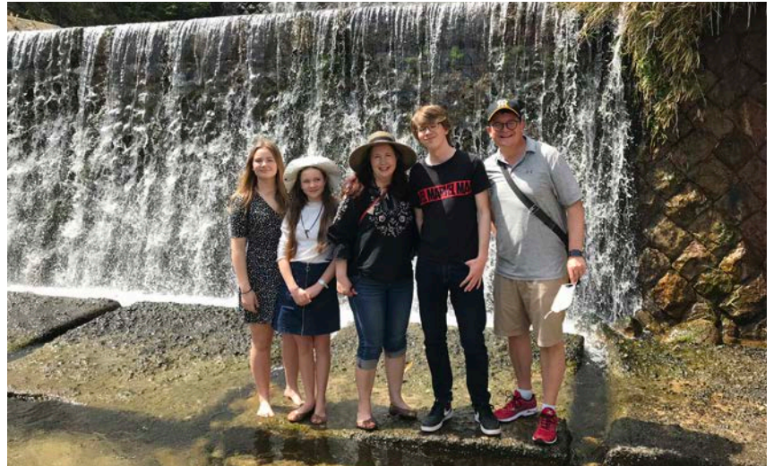
Kuvaa varten kasvosuojus otettiin pois. Muuten pidämme sellaisia ulkona liikkeessämme.

Näillä näkymin pystymme aloittamaan tavalliset jumalanpalvelukset kesäkuun alusta. Korona-tapaukset ovat kääntyneet hiljalleen laskuun, mikä antaa toivoa siitä, että arki pääsisi normalisoitumaan joskus.