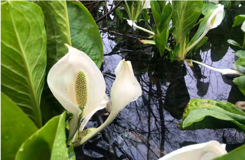
"Valkomajavankaali" kukkii toukokuussa Naganon läänissä.

Seurakunnassa on sunnuntaisin ollut yllättävän paljon kävijöitä. Kolme vuotta sitten toukokuun ensimmäisenä sunnuntaina (keskellä "kultaisen viikon" lomaa) kirkossa oli 18 osallistujaa, kun tänä vuonna meitä oli 41.