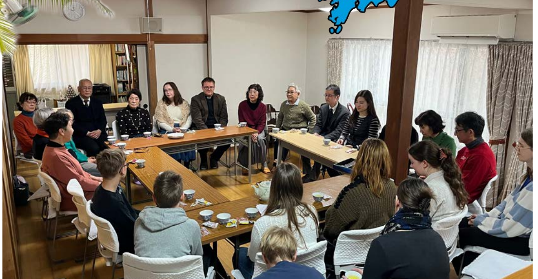
Vuoden viimeisenä päivänä jumalanpalveluksen jälkeen kokoonnuimme vihreän teen äärelle ja kukin sai kertoa kuluneen vuoden pääkohtia. Me kerroimme että koemme ihmeellisenä Jumalalan johdatuksena sen, että saamme jälleen olla Japanissa lähetystyössä.