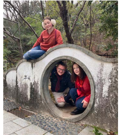
Siunattua uutta vuotta täältä Japanista kaikille!

Se muistutti itseäni taas siitä, kuinka tärkeää on päivittäin kuunnella ja lukea Jumalan Sanaa. Siinä on voima. Siinä on sydämen ilo ja riemu. Rohkaisen kaikkia "syventymään Psalmiin tai muuhun raamatunkohtaan" ihan joka päivä! Samalla uskallan näin lähetystyöntekijän roolissa rohkaista kaikkia löytämään viikottaisen jumalanpalvelusyhteisön itselleen, jos sellaista ei vielä ole. Tätä suosittelen kaikille täällä Japanissakin. (AP)