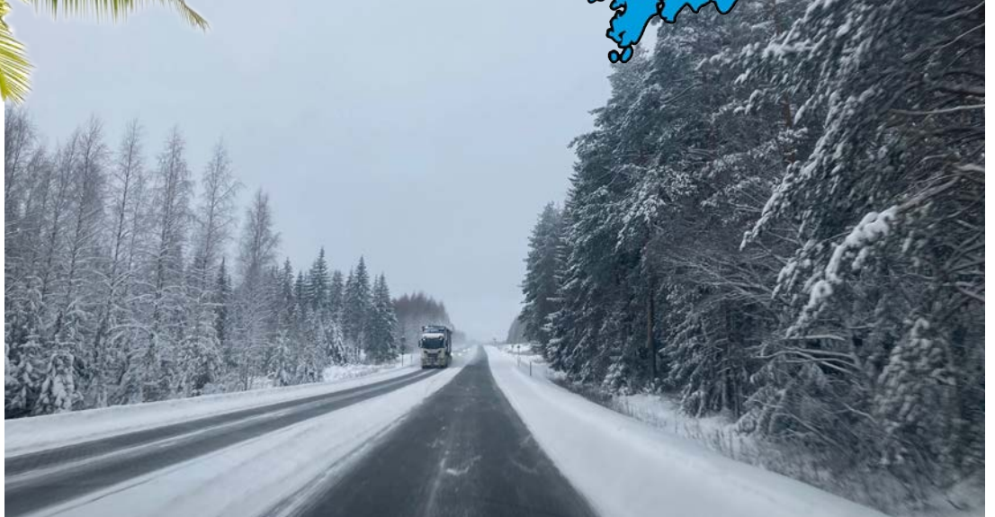
Alamme nyt suunnitella kevään ja alkukesän vierailuja lähettävissä seurakunnissamme. Tulemme viettämään aikaa jonkin verran auton ratissa.