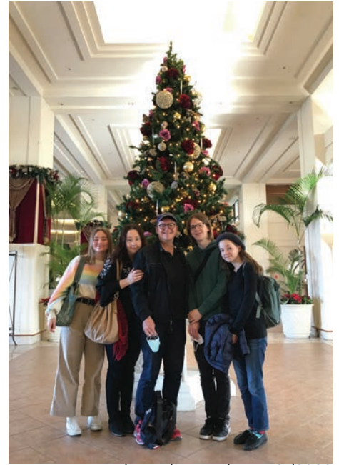
Palmuperhe ja joulupuu 12/2020