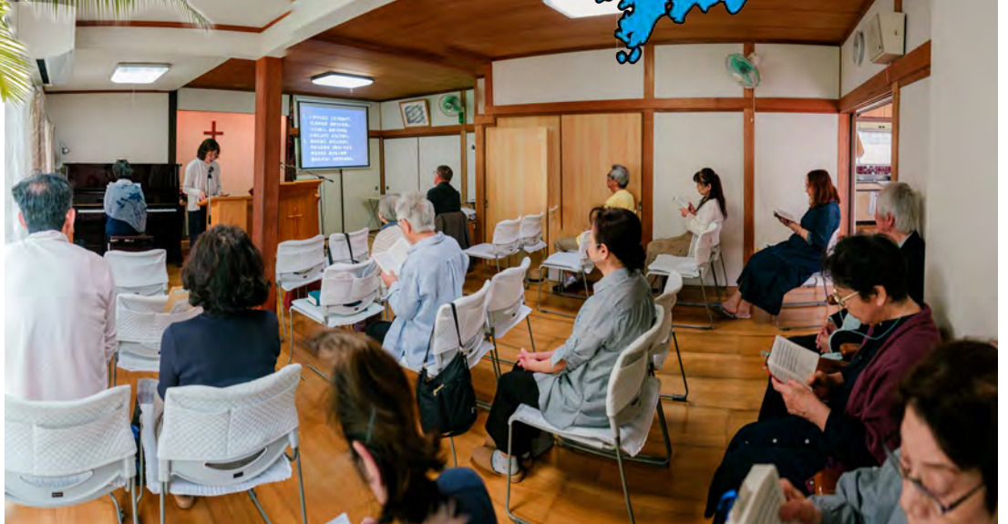
Iloitsemme siitä, että viimeisen kuukauden ajan uusi pariskunta on alkanut käydä Kita-Suzuradain sunnuntain jumalanpalveluksissa. Vielä olisi tyhjiä tuoleja tarjolla uusille kävijöille...