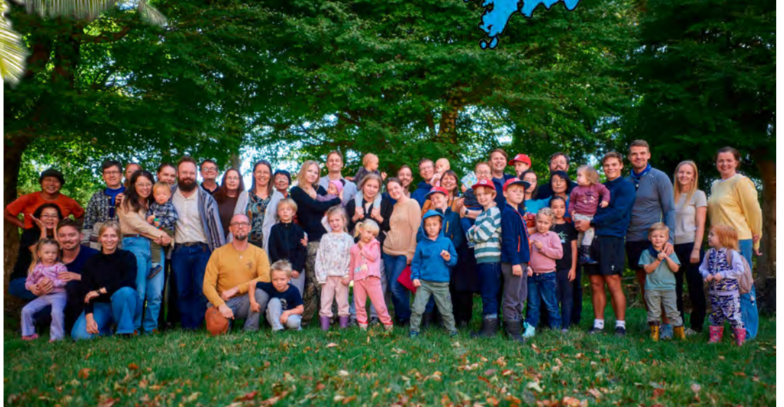
Länsi-Japanin kirkon työyhteydessä toimivia lähetystyöntekijöitä lapsineen ryhmäkuvassa. Löydätkö Palmut?