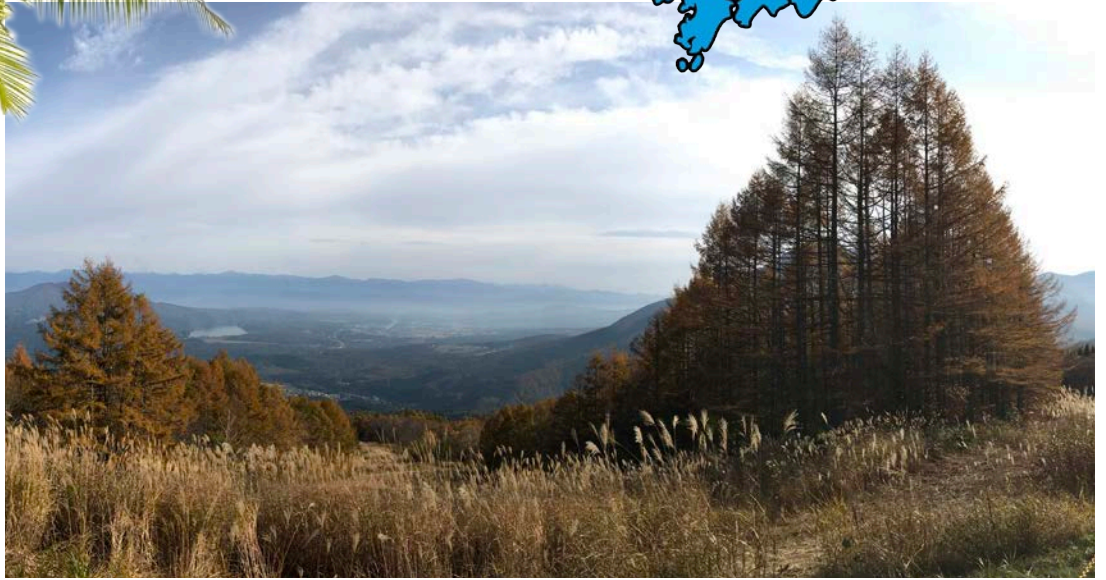
Syksyinen vuoren rinne