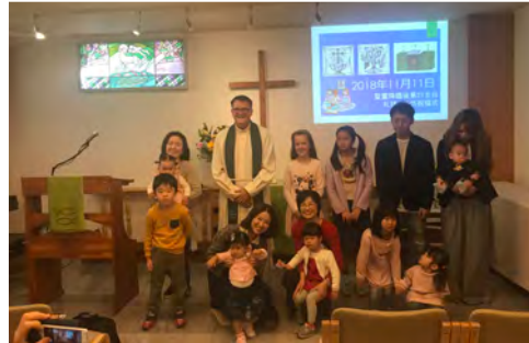
Rukoilimme seurakuntamme lapsille Jumalan siunausta ja varjelusta!