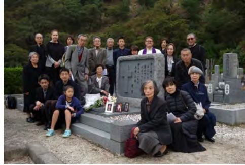
Seurakuntamme hauta on noin tunnin ajomatkan päässä Otsussa.