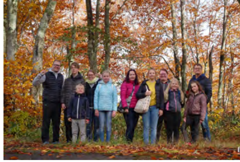
Vietimme lähettien syysretriittiä Nojirissa, Naganon läänissä.