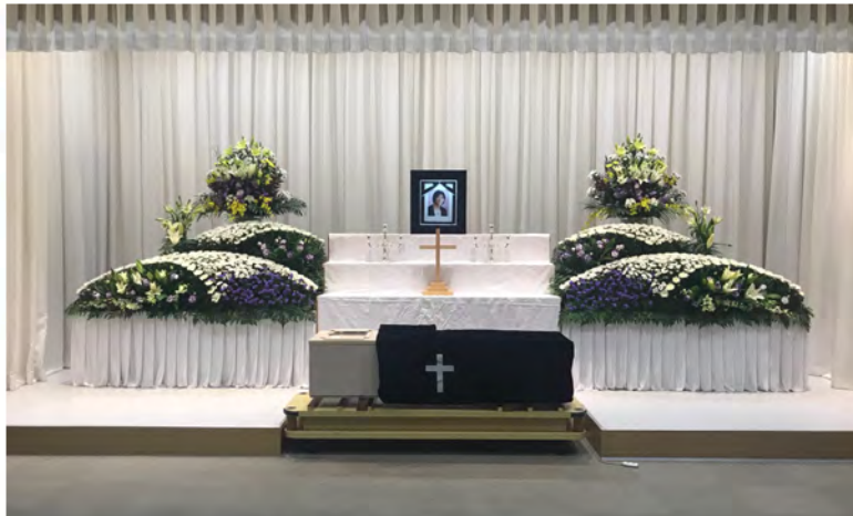
Perjantaina kävimme sairaalassa tapaamassa 47-vuotiasta seurakuntalaistamme. Taivaskutsu tuli sunnuntaina ja hautajaiset pidettiin maanantaina 12.11.2018.