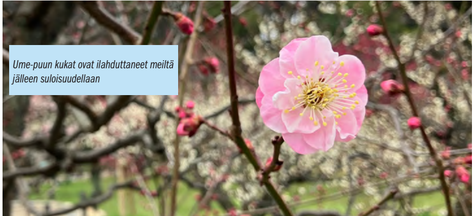
Ume-puun kukat ovat ilahduttaneet meitä jälleen suloisuudellaan

Emme siis luovuta. Jumala on luvannut olla kanssamme. Hän on kutsunut meidät palvelemaan Japanissa.