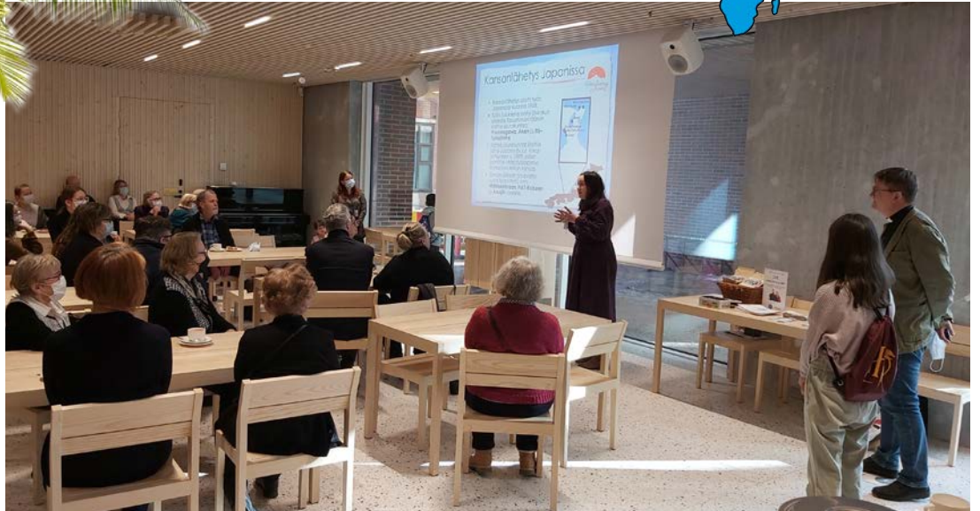
Asako kertoo Kansanlähetysten työstä Tikkurilan seurakunnan kirkkokahveilla.