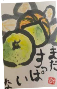
Ensikertalaisen kortti e-tegami -taidepiirissä. Se tarkoittaa "kuvakirjettä"