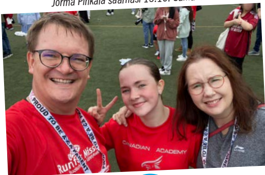
Tyttärenne koulun urheilutapahtumassa.