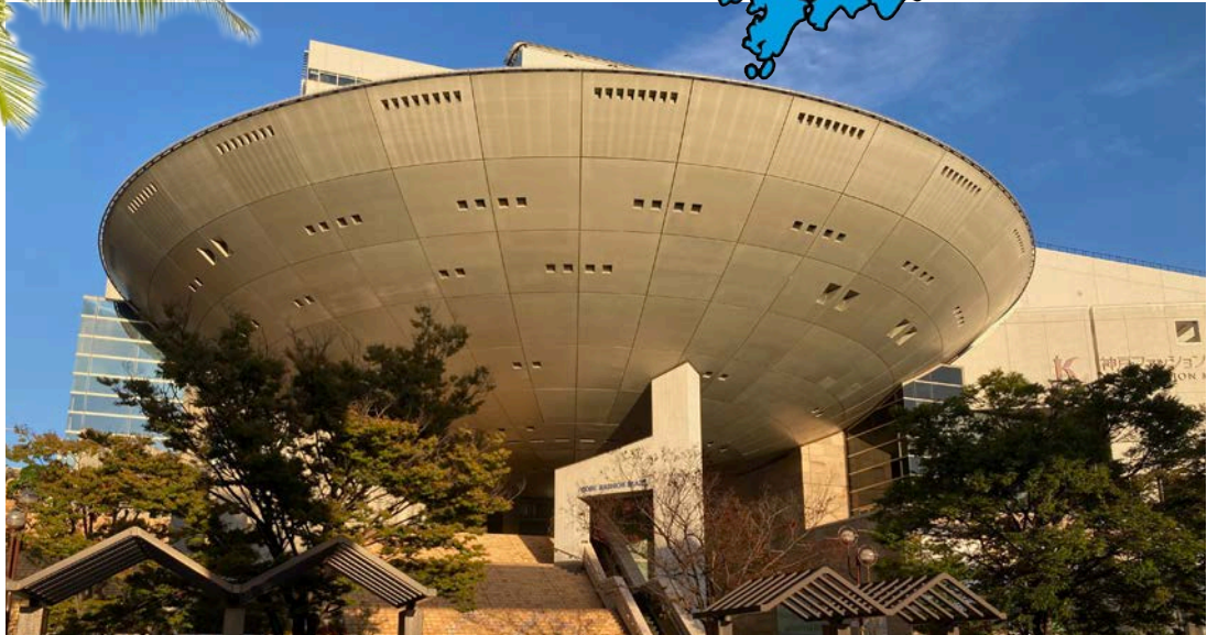
Onko se UFO? Ei. Onko se vesitorni? Ei. Se on Koben muotimuseo ja konserttisali, joka sijaitsee kotimme lähelle Rokkoon tekoosaarella.