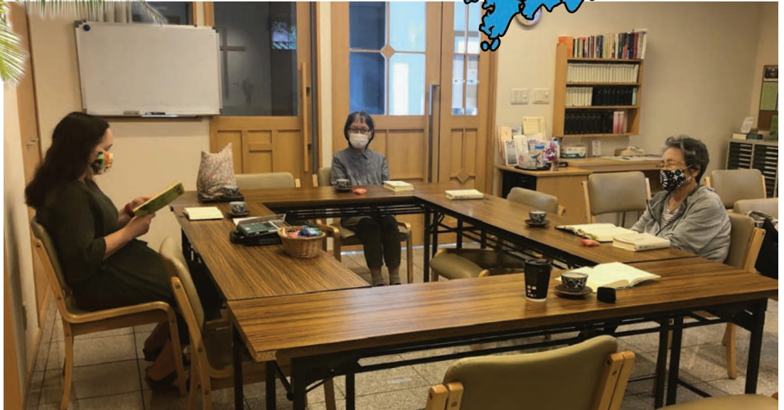
Turvavälit kunnossa keskiviikkoamun rukouspiirissä. Maskin käyttö Japanissa ei herätä intohimoja, mutta vaikeuttaa toki kuullun ymmärtämistä.