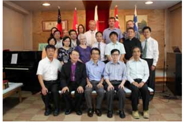
Kolmen kirkon ja lähetysjärjestöjen edustajat

Pimeässä toisen kokoushuoneessa kuului ääni... tip, tip, tip... Valot päälle. Ikkunankarmista valuu vettä lattialle, johon oli jo muodostunut pieni lätäkkö. Äkkiä rähtiä hakemaan ja kuivaamaan lattiaa. Mistä vesi tulee sisään? Ikkunastako? Ei vaan sitähan valuu seinää pitkin katonrajasta. Kolmannen kerroksen aulatilun nurkassa oli myös vettä pienen lätäkön verran. Edelleen on mysteeri, mistä tuo vesi tuli. Ikkunankarmi vaatii pientä remonttia, mutta mitään havaittavaa vahinkoa ei taifuunista tullut. Pieni epävarmuus kuitenkin... onkohan jossain seinän sisällä vettä? (LP)