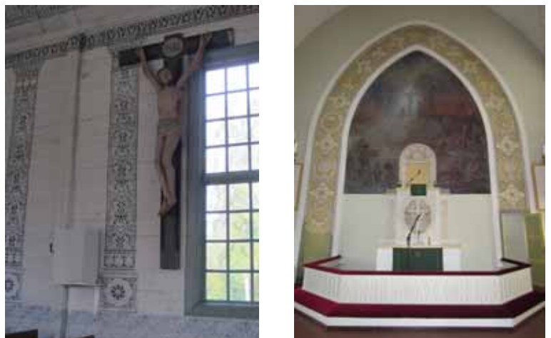
Kuvat Pomarkun vanhasta ja uudesta kirkosta