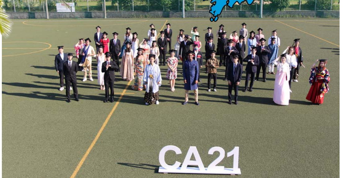
Kansainvälisessä koulussa ei laulettu suvivirttä 29.5. ylioppilajuhlissa. Viralliset IB-tulokset tulevat vasta 5.7., mutta perheessämme on nyt kolme lukionsa päättäneitä.