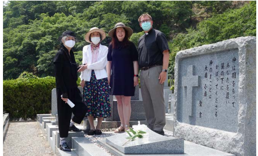
Pääsiäisenä pidettävä hartaus seurakunnan haudalla toteutui vasta kesäkuussa, sillä viranomaisuuksien mukaan liikkumista toisiin lääneihin piti välttää huhti-toukokuussa

Lapsilla loppui koulu tänään tiistaina. He ovat nyt virallisesti kesälomalla. Toivottavasti koulu pääsee aloittamaan uutta lukuvuotta elokuussa suunnitelmien mukaan. Paljon on epävarmuutta, mutta voimme nämä kaikki asiat jättää Pyhän Jumalan haltuun, sillä hän on luvannut pitää meistä huolta: