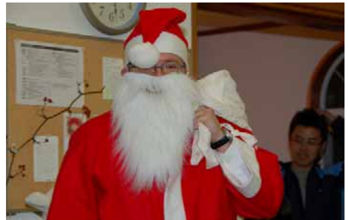
Joulupukki vieraillee Itä-Tokushiman kirkolla

Uusi vuosi on Japanissa vuoden tärkein juhla, jota voitaisiin verrata Suomen jouluun siinä mielessä, että uutta vuotta vietetään rauhallisesti perheen ja suvun parissa. Jouluhan taas on vähän niin kuin eurooppalainen uusi vuosi hilpeine juhlineen.