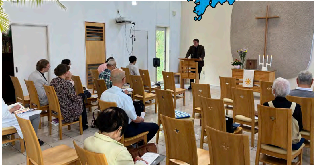
Awajin evankelisluterilainen seurakunta sijaitsee Sumoton kaupungissa. Kirkkosali on kaunis, mutta äänentoiston kanssa on edelleen haasteita.