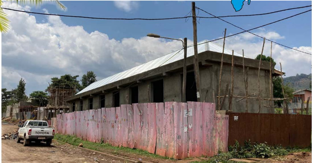
Sinne se nousee. Jimman synodin monitoimikeskus. Ensimmäinen vaihe on vuokrattavien kauppatilojen valmistuminen.

Lue lisää: https://kansanlahetys.fi/tyontekijat-ja-kohteet/koulutuskeskus-etiopian-jimmaan/