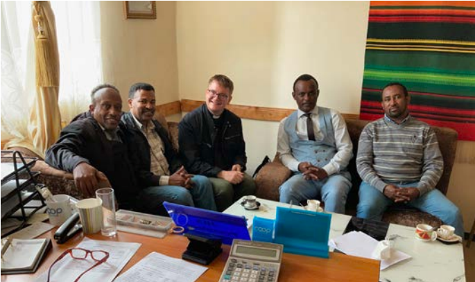
Jimman synodin työntekijöiden kanssa palaverissa.

Matka Etiopiaan oli merkityksellinen ja esiin tuli paljon erilaisia tarpeita ajatellen lähetystyötä siellä. Rakennuskustannukset ovat nousseet jyrkästi, johtuen sodan aiheuttamien tuhojen jälleenrakentamisesta. Työntekijöitä tarvitaan monenlaisiin tehtäviin. Työtä on paljon mutta työntekijöitä vähän. Jatkathan rukousta Etiopian, Mekane Yesus -kirkon, rakennusprojektien, kummilapsityön, raamatunkäännöstyön puolesta.