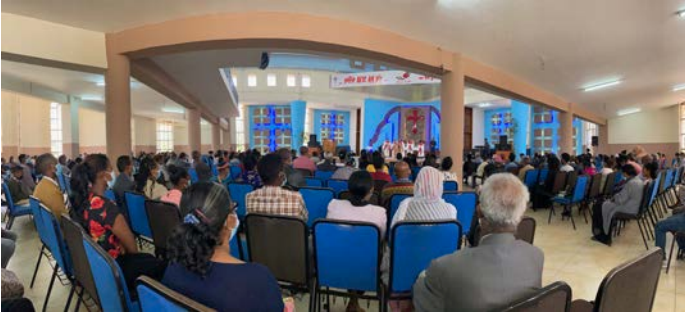
Addis Abeban Mekanissan seurakunnan jumalanpalveluksessa kaikilla oli maskit