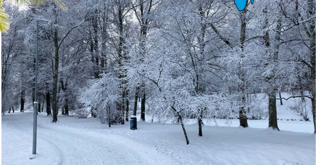
Tämänlaisessa talven ihmemaassa Asako ja minä käymme lähes joka päivä kävelyllä. Keravajoen vartta kulkee mukava reitti lyhyelle tai vähän pidemmälle lenkille.