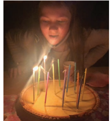
Nuorimmainen täytti kolmetoista, joten lapset ovat nyt kaikki teini-ikässä.