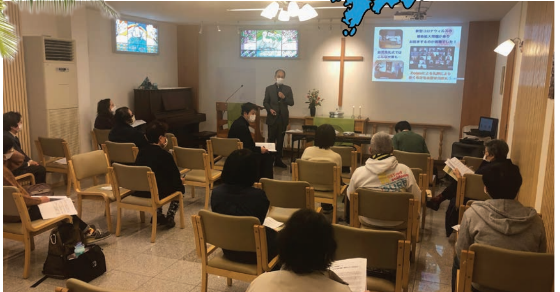
Vuosikokous Nishinomiyan seurakunnassa pidettiin heti helmikuun ensimmäisenä pyhänä. Vieressä alhaalla vuosikokousmonisteen kansilehti.