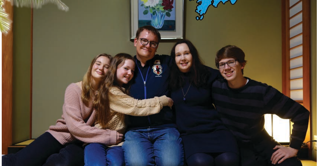
Yllä: Palmun perhe helmikuussa 2010. Alla: Kirje numero 1.