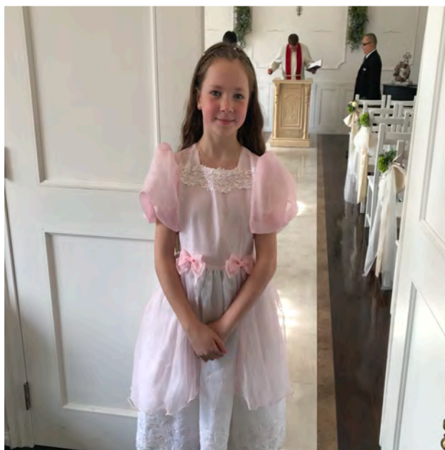
Aimi pääsi morsiusneidoksi