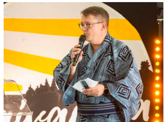
Juontotehtävissä Kansanlähetyspäivien aikana.