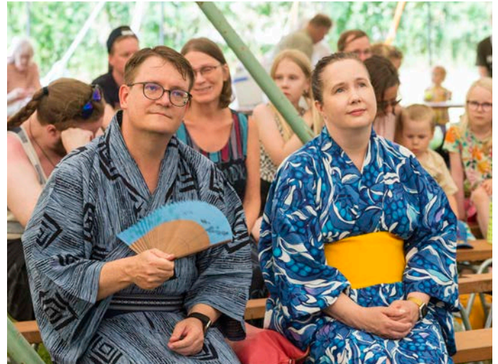
Asakon kanssa ehdimme hetkeksi istahtaa alas juhlateltan ohjelmaa seuraamaan.

Japanilaisten kristittyjen Euroopan konferenssi järjestettiin tänä vuonna 39. kertaa. Teema oli "Vapaus Kristuksessa". Osallistujia oli noin 160 henkeä, joukossa vajaa parikymmentä Japanin lähetystyöntekijää. Vähän jännitti, että miten se japaninkieli oikein sujuu vuoden hiljaiselon jälkeen, mutta kyllä se pienryhmäkeskustelukin hyvin onnistui. Raamattuopetusten jälkeen illalla nimittäin oli vielä pienryhmät, jotka oli jaettu aika lailla ikäryhmittäin. Saimme Asakon kanssa kutsun käydä japanilaisessa seurakunnassa Etelä-Korean Seoulissa... Ehkäpä voimme vastata tähän kutsuun parin vuoden sisällä, kun olemme ensin palanneet Japaniin lähetystyöhön. Herra ohjatkoon askelemme kun teemme tulevaisuudensuunnitelmia.